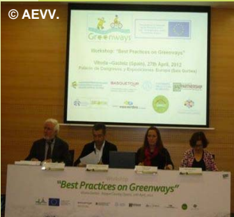
À Vitoria-Gasteiz, l'atelier consacré aux meilleures pratiques en matière de voies vertes.

manière importante les possibilités de tourisme durable en Europe.