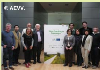
Les membres du groupe de travail Greenways4Tour lors du lancement du projet.

Le projet a été présenté à Vitoria-Gasteiz (Espagne) lors d'un atelier consacré aux meilleures pratiques en matière de voies vertes. Vitoria-Gasteiz a été nommée Capitale verte européenne 2012. Il était donc opportun d'organiser le lancement du projet dans cette ville avec le soutien de Basquetour, l'organisme touristique du Pays basque. Basquetour est également partenaire du projet. Un grand nombre de voies vertes qui connaissent un succès exemplaire ont été présentées comme autant d'échantillons de bonnes pratiques et ont donné une belle image de la manière dont le réseau des voies vertes européennes peut encourager le tourisme durable à