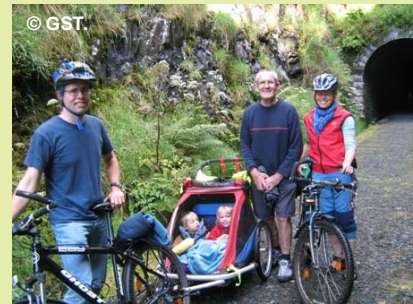
Les voies vertes et les véloroutes de qualité sont la clef qui permettra de créer une culture plus « cyclophile » à travers le pays. ○ ● ●

Pour plus de détails, voir : http://www.southerntrail.net/documents/Press%20Release%20with%20Grant%20Details%20June%202012.pdf