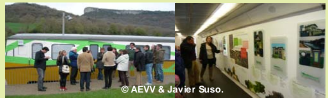
Le centre d'accueil de la voie verte Vasco-Navarro à Antoñana. Les trois voitures abritent une boutique où l'on vend des produits locaux, une zone d'information sur la voie verte et un musée dédié à l'ancien chemin de fer « El Trenico ».