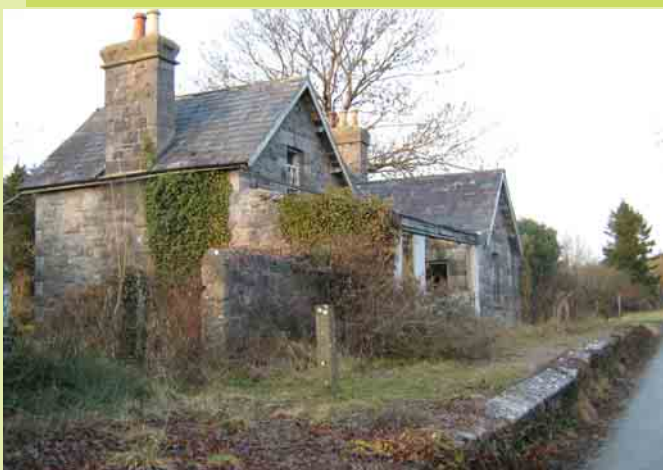
La ruta prolongada pasa por la antigua Casa de la Estación de Ardagh (1867). Actualmente es privada.

El sábado, 18 de junio de 2011 se celebraron tanto los veinte años desde el establecimiento del Grupo de Acción Great Southern Trail como la reciente ampliación que permite que el tramo entre Rathkeale y Abbeyfeale del viejo ferrocarril de Limeric-Tralee pueda ser utilizado por peatones y ciclistas.