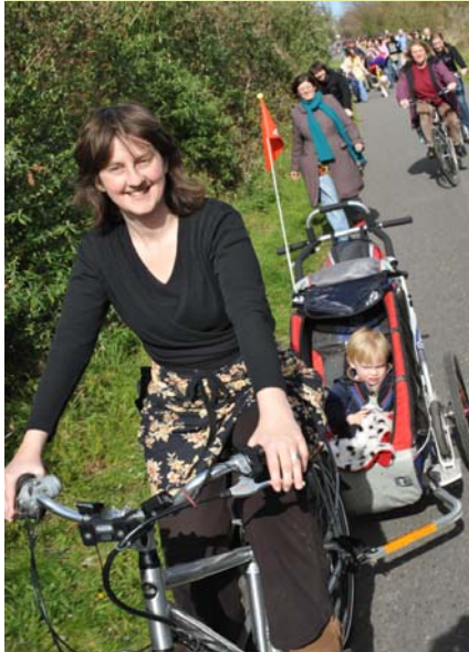
Una madre en bicicleta con su hijo en el carrito-peatones y ciclistas al fondo (Bristol & Bath Railway Path National Route 4)

Ahora es el momento de invertir en Vías Verdes, en beneficio de todos