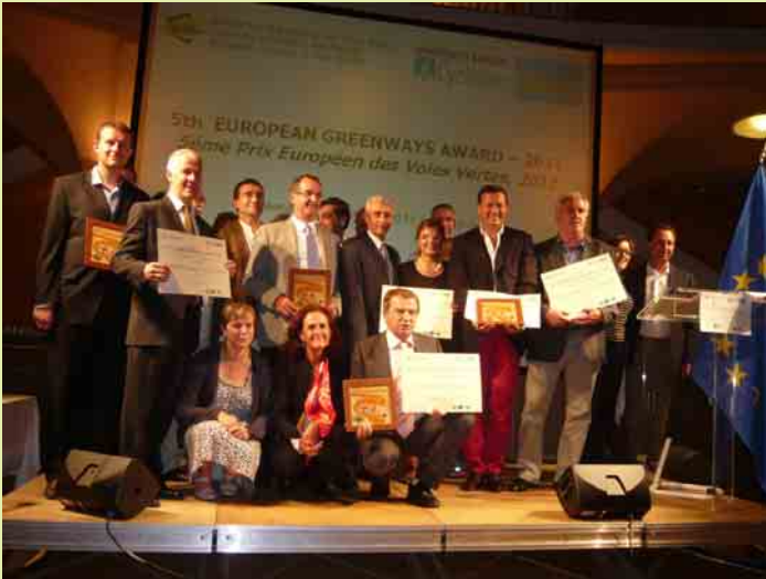
Premios tras la ceremonia de entrega en Epinal (Francia)

Ocho vías verdes de Francia, Irlanda, Reino Unido, Italia y España fueron premiadas como referencia europea de buenas prácticas. La ceremonia de entrega de premios tuvo lugar en la ciudad de los Vosgos de Epinal, en Francia, el pasado 8 de septiembre.