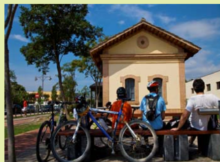
Foto: Xevi F. Güell - Consorcio de las Vías Verdes de Girona. Ciclistas en Castell d'Aro, en la antigua estación del ferrocarril del Carrilet hoy transformado en Vía Verde.

Las vías verdes de Girona, en España, también ganadoras de un PEVV, registraron 1.800.000 viajes en 2010(3) y