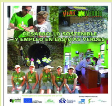
Portada de la publicación "Desarrollo Sostenible y Empleo en las Vías Verdes"

Esta publicación y audiovisual son fruto del proyecto "Vías de Empleo Verde" desarrollado por la FFE (2009 - 2011) a través del Programa empleaverde de la Fundación Biodiversidad, con el apoyo del Fondo Social Europeo, y la colaboración de otras instituciones.