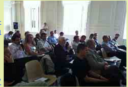
participantes en el Taller 4 "la importancia de una buena señalización en las"