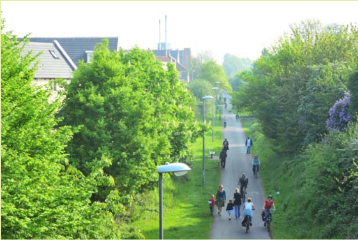
Por la mañana temprano, camino de la escuela y del trabajo por la vía verde, libre de tráfico, que discurre a través de una zona de casas (Bristol y Bath Railway Path, Carretera Nacional 4)

Más de 20.000 Km., 407 millones de trayectos a pie y en bicicleta, 3 millones de usuarios. Septiembre señaló el 15º aniversario de la "National Cycle Network", que registra más de un millón de viajes a pie y a bicicleta cada día.