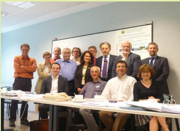
Foto: Miembros de la AEVV con el Director de Turismo de la Comisión Europea en la pasada Asamblea General en Bruselas (2009).

~ Asamblea General de la AEVV, Sevilla (España) 22 de marzo 2011