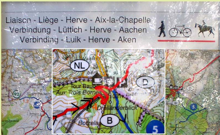
Foto: Hacia Aquisgrán, panel de las 3 fronteras

Co-fundador de la AEVV, la asociación belga Chemins du Rail colabora estrechamente en el desarrollo del RAVeL, la red de vías verdes de la Región Valona, y de numerosos proyectos comunales de caminos de movilidad no motorizada.