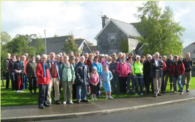
Foto: el grupo del GST en la antigua estación de Newcastle West en el Día Nacional del Senderismo.

El Día Nacional del Senderismo, el domingo 3 de octubre, fue la ocasión de celebrar la apertura de una nueva sección sobre la vía verde del Great Southern en la República de Irlanda