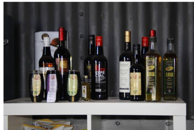
Foto Detalla productos Sabores de laVV: Aceite D.O. Baena, Vino D.O. Montilla-Moriles, vinagre balsámico