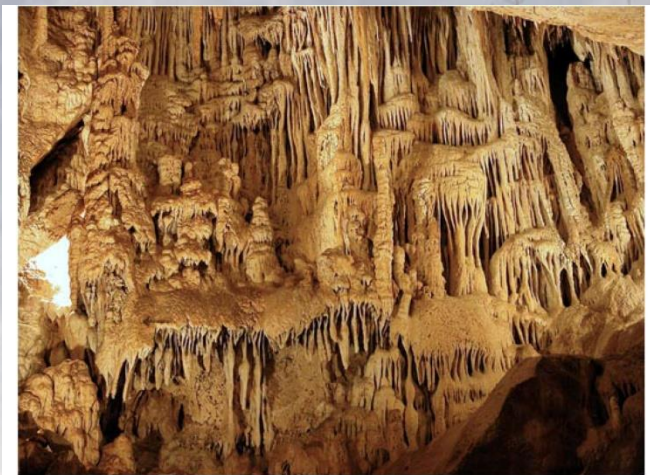
Foto de la Cueva de los Murciélagos