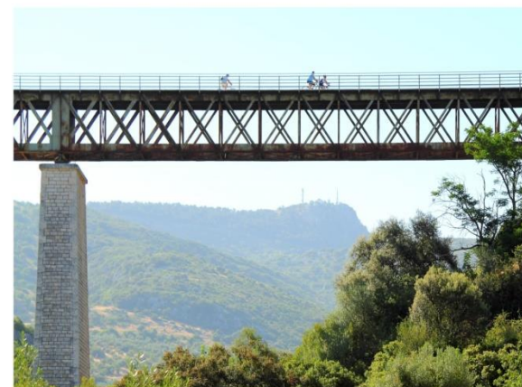
Picture. Overview of Viaduct on the Subbética Greenway. In the background the Ermita de la Virgen de la Sierra ( P. N. Sierras Subbéticas ) and called Balcon de Andalusia .