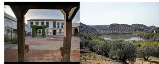
Picture: San Francisco Rural Hotel